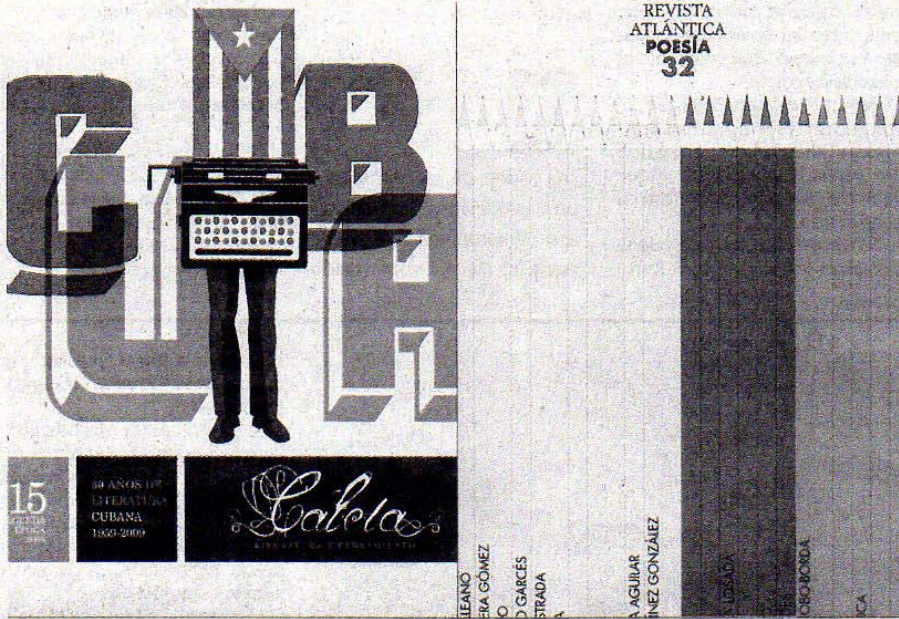
Portadas de las revistas 'Caleta', de su nuevo número, y 'RevistAtlántica', de su edición última.

Ángel García López (Rota, 1935) pertenece al Grupo Poético del Sesenta. Su extensa obra contempla los más diversos géneros y se caracteriza por una bella forma clásica y ortodoxa. Muchos de sus poemas se encuentran traducidos a más de seis idiomas y han obtenido numerosos premios, entre los que se destacan galardones como el Adonais 1969, el Nacional de Literatura en 1973, Nacional de la Crítica en 1978, Hispano-